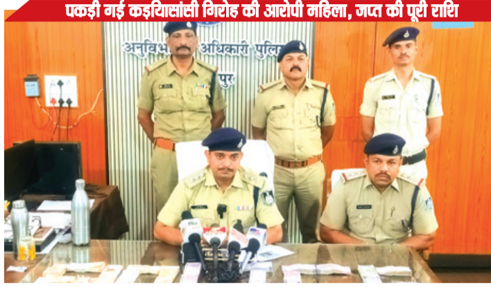
पकड़ी गई कड़ियासांसी गिरोह की आरोपी महिला, जब्त की पूरी राशि