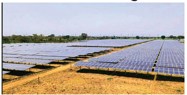
हरिभूमि न्यूज ►► इटारसी